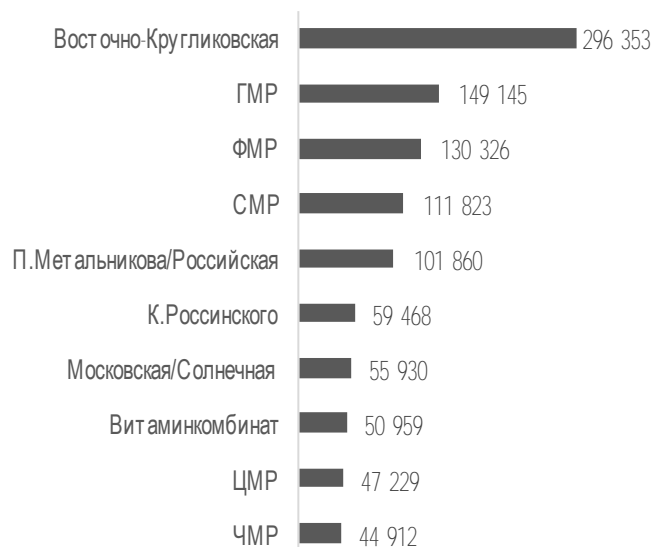
ТОП-10 районов г. Краснодар по совокупной площади объектов, строительство которых начато в 2017 г., кв. м